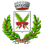
Comune di Compiano